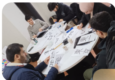
来日前オリエンテーション

受け入れ先となる日本語学校・大学も増加し、日本で難民を受け入れる基盤が広がっています。