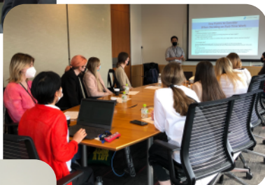
来日後オリエンテーション