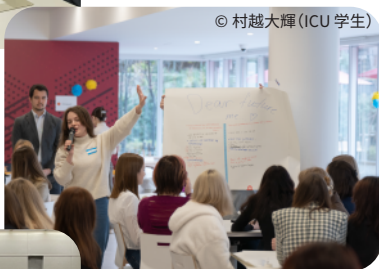
学生・企業とのネットワーク作り