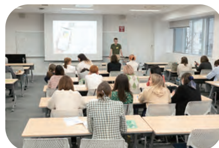
企業インターンの学生による製品のプレゼンテーション