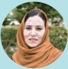
SJさん(アフガニスタン)

日本の大学で学ぶことは、良い知識と経験を得る絶好の機会なので、私は、日本で勉強を続けたいと思っています。現在、修士課程への準備をしており、終戦後のウクライナの発展に役立つ知識を得たいと思います。将来は外交官になり、希望する分野の優れた専門家になり、在日ウクライナ大使館で、ウクライナと日本の関係を発展させたいと思います。