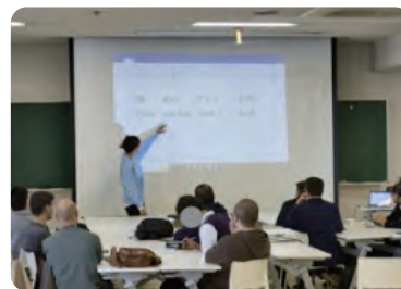
シリアとアフガニスタンの学生のリユニオンと来日時オリエンテーションの様子

就職活動を予定する難民の学生等に、就職活動関連情報をSNS等で配信しました。また、受け入れ留学生の雇用に関心をもつ企業等とのネットワーキングを進めています。2023年度は、今年度拡大した企業とのネットワークを活かし、就職活動に関するセミナーを開催するなど、活動を拡充していきます。