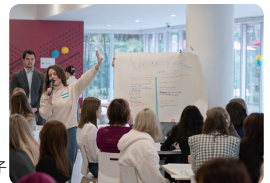
ウクライナ学生のリユニオンの様子